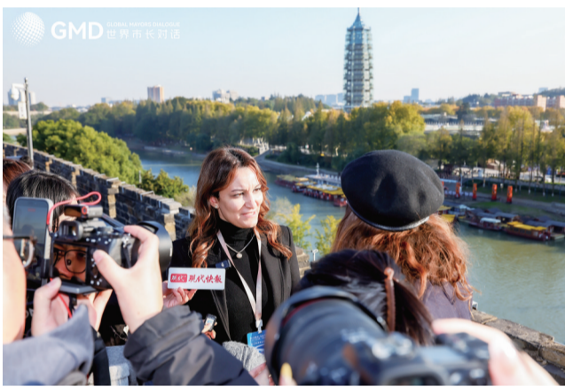
在中华门瓮城俯瞰秦淮河，埃及吉萨省副省长感叹秦淮河美到她想要家

接下来，“城市展场”“场景沙龙”“世界市长主题对话”等活动将如期举行。此次“世界市长对话·南京”活动通过丰富的交流形式，为全球滨水城市搭建了重要的对话平台，对推动全球城市可持续发展具有积极意义。