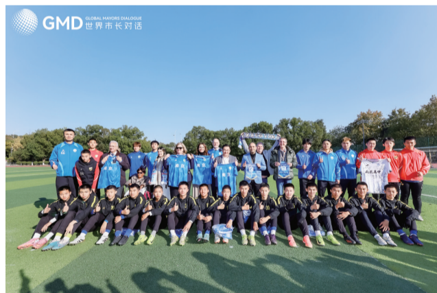
嘉宾走进雨花台中学，与“苏超”南京队员、教练互动交流