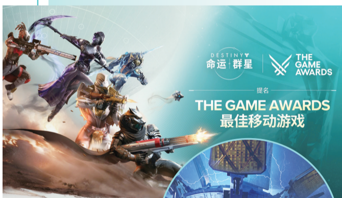
《命运:群星》获得 TGA提名