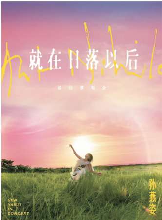
孙燕姿“就在日落以后”巡回演唱会海报