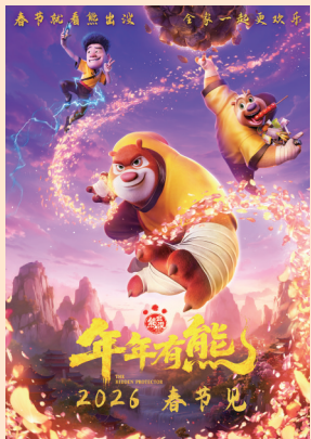
均为电影官方海报

马年新春将至，2026 年电影春节档即将登场。1 月 28 日，合家欢喜喜剧冒险电影《熊猫计划之部落奇遇记》官宣将于 2 月 17 日（大年初一）上映，成为春节档又一位“重磅选手”。至此，《熊猫计划之部落奇遇记》与《飞驰人生 3》《镖人》《惊蛰无声》《星河入梦》《熊出没·年年有熊》六部影片正式集结，共贺新春。