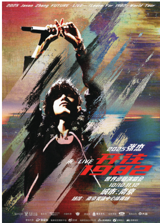
张杰南京演唱会海报

南京市文化和旅游局相关人士告诉现代快报记者，来自五湖四海的粉丝为演唱会奔赴南京，演唱会票根大礼包成为他们走进南京大街小巷的“邀请函”。数据显示：2025 年，南京累计举办 5000 人以上大型演出 116 场，平均票价为 800 元以上，平均每场观众约 1.52 万人次，全年大型演出直接拉动其他消费 100