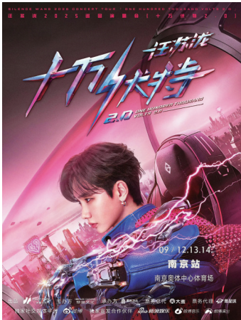
汪苏泷南京演唱会海报