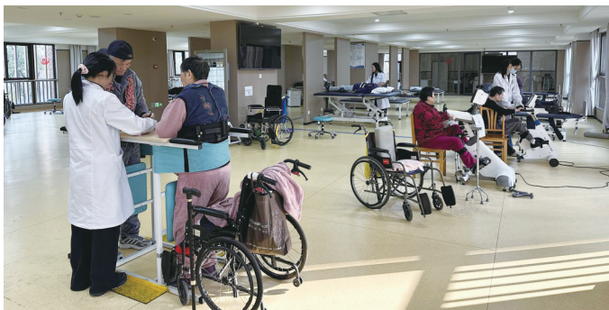
常州溧阳市马垫护理院的老人正在做康复

2025年,江苏新增13家基层医疗卫生机构增设护理院,带动社会力量举办护理院15家,共新增床位3400余张。全省护理院总数占全国1/3以上,居全国第一,越来越多的老人实现“医养不用二选一”。而解决了“住得下”的问题后,如何让失能、半失能老人“活得好”,成为护理院服务升级的核心方向。