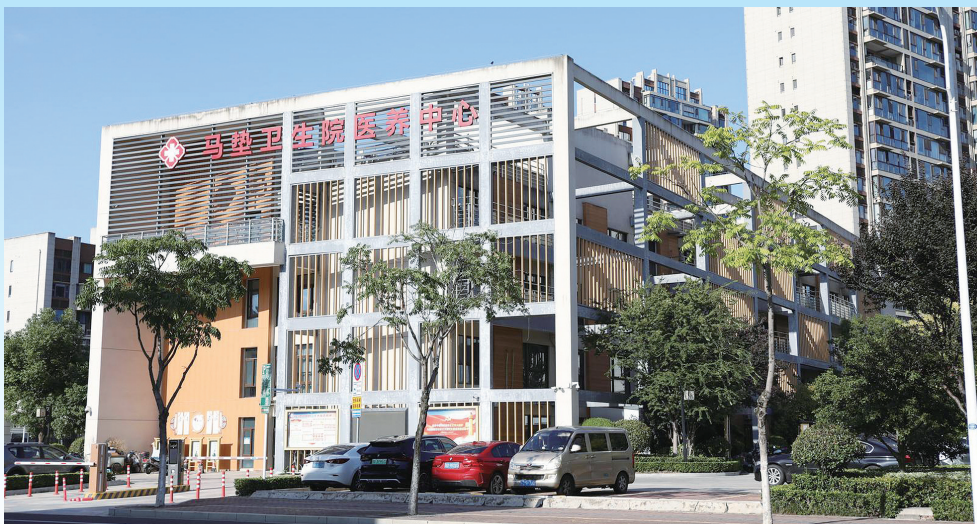
常州溧阳市马垫护理院