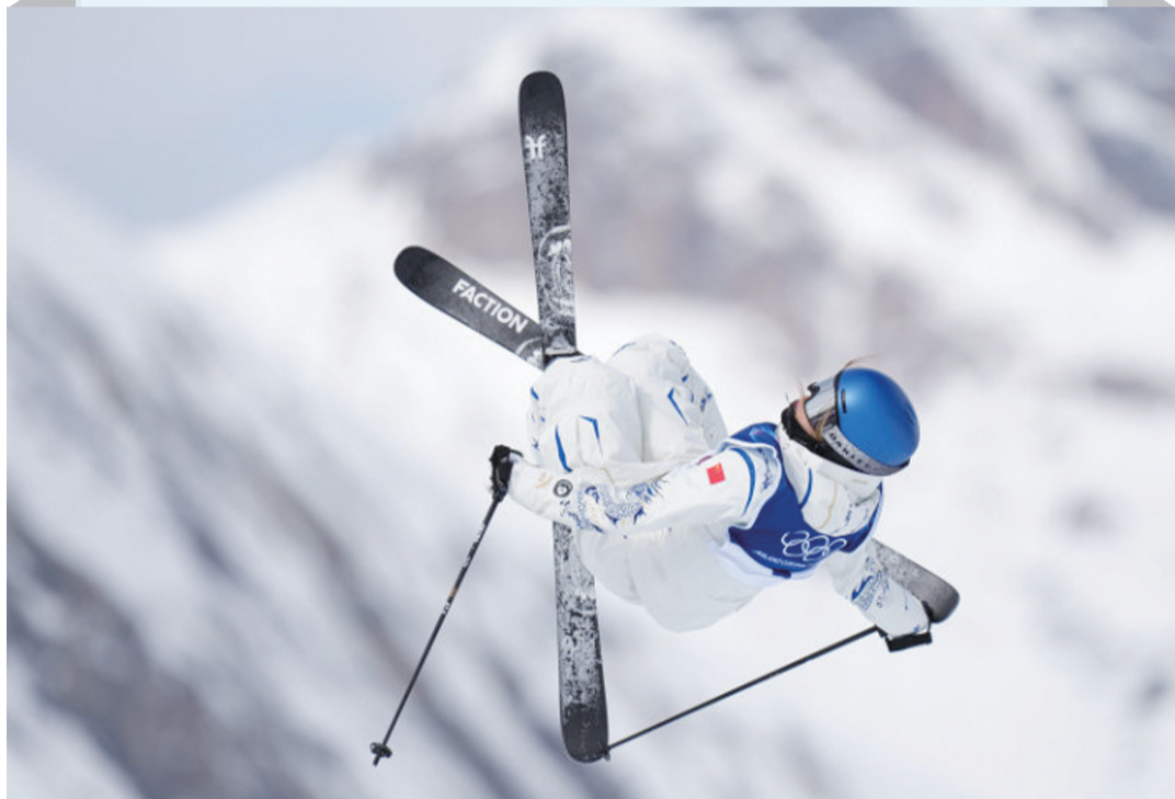
2月9日，谷爱凌在决赛中

两天前的预赛，谷爱凌让所有关注她的人都捏了把汗。她在第一轮第二顺位出发，却在第一个道具上就重心偏移，侧摔在雪地，首轮仅得1.26分，名次瞬间跌至所有26名选手的末尾。