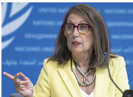
蕾韦卡·格林斯潘

据悉，现任联合国秘书长古特雷斯于2017年1月开始任职，2021年6月获得连任，任期将于今年12月31日结束。