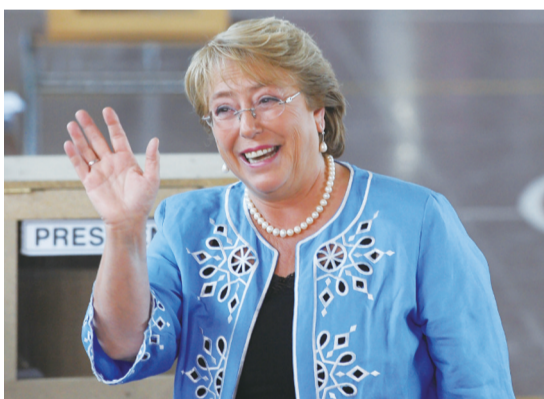
米歇尔·巴切莱特 据新华社