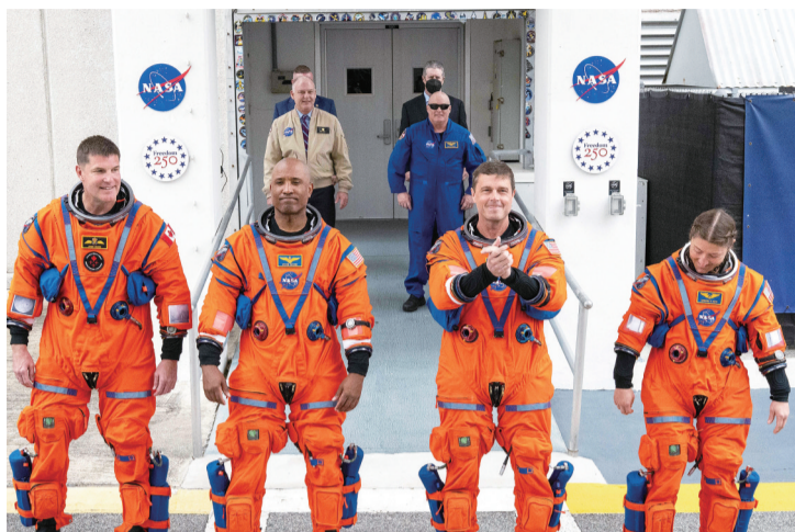
“阿耳忒弥斯2号”四人乘组

美国航空航天局1日实施“阿耳忒弥斯2号”载人绕月飞行任务，使用美国新一代登月火箭“太空发射系统”和“猎户座”飞船，将4名宇航员送往月球轨道，展开为期10天的绕月飞行。 这是美国自1972年阿波罗17号登月任务以来的首次载人“探月之旅”，也是美国“阿耳忒弥斯”登月计划继“无人绕月”任务之后的第二步。这次不登月、只绕月的载人任务重要性几何？有哪些关键技术值得关注？宇航员安全又如何保障？