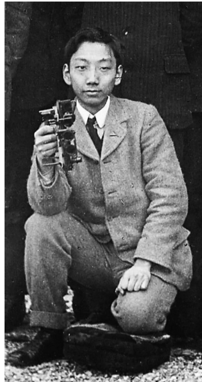
在格拉斯哥大学求学时的丁文江