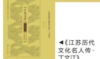
《江苏历史文化名人传·丁文江》