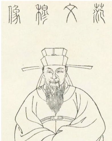
范成大画像