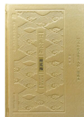
《江苏历史文化名人传·范成大》