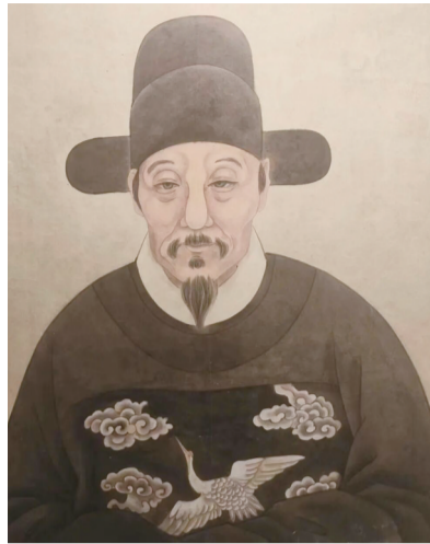
王世贞像 来自凌祖诒辑《太仓乡先贤画像》