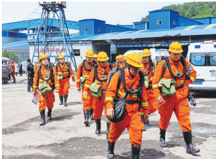
5月23日在山西通洲集团留神峪煤矿拍摄的救援现场