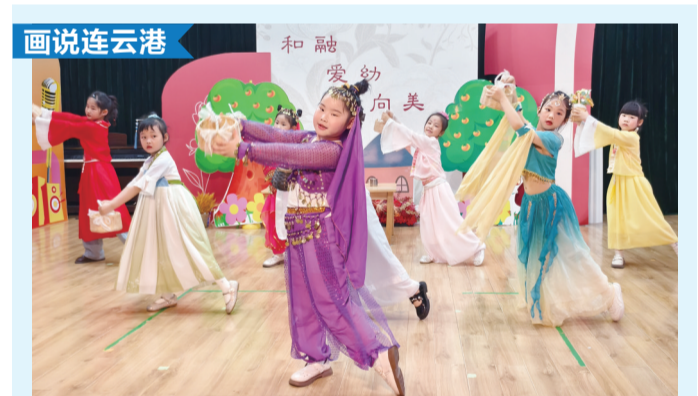
近日,连云港市东海县第二幼儿园开展了以“绘本打开的N种方式”为主题的绘本剧展演,孩子们与家长、老师一同读绘本、做绘本、演绘本,让孩子们在多元中成长为爱阅读、善思考、能动脑、敢表达、会生活的小主人。

项目投用后,2000吨级船舶可经宿连航道直抵连云港港,实现腹地与出海口无缝对接,有效降低物流成本、提升运输效率,畅通企业物流通道。此次合作是两地深化港航协同、推进区域融合的重要举措。 王晓宇 张新语